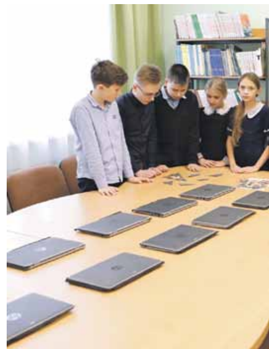
В библиотеке школы № 2