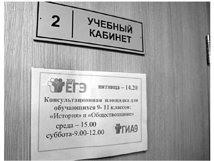
Консультационные площадки в Краснояружской школе № 2