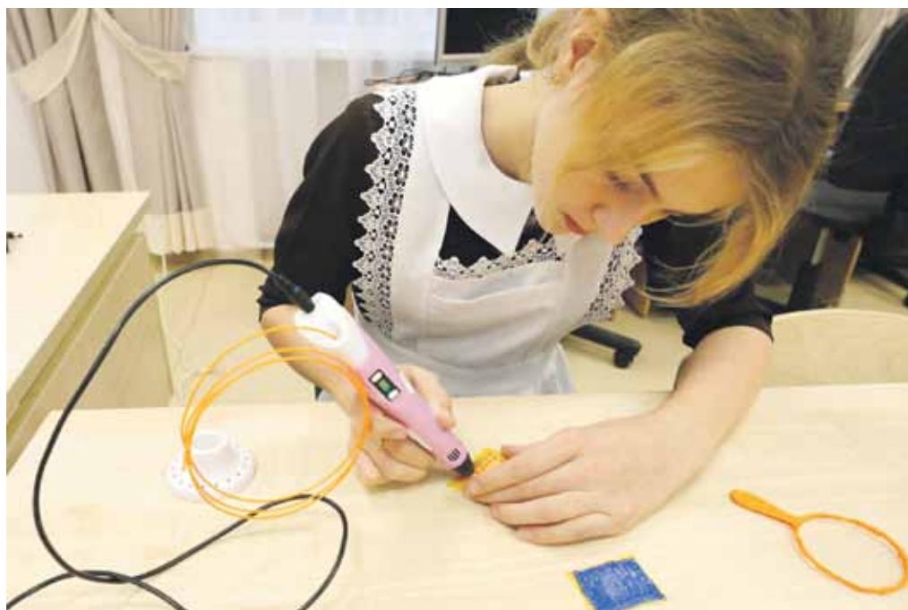
В Вязовской школе дети быстро освоили 3D-ручки