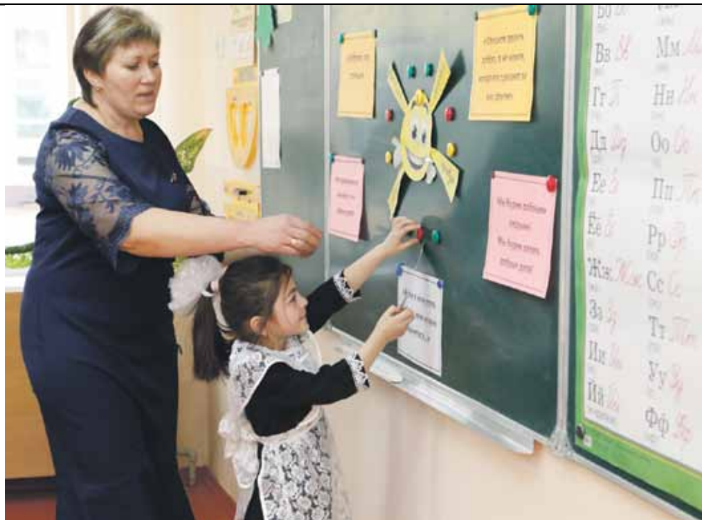
Урок в начальной школе села Степное