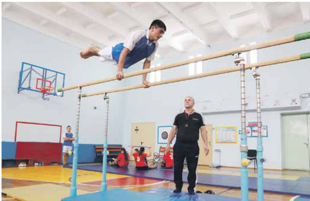
На внеурочных занятиях по спортивной подготовке в Степнянской школе