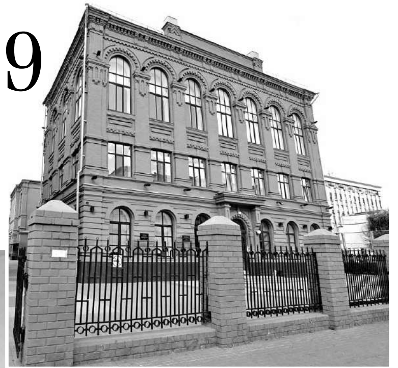
Лицей № 9

— Использование картирования позволило выявить проблемные места в образовательной деятельности и проанализировать возможности их устранения. Сейчас в лицее разработан 21 бережливый проект, шесть из которых уже реализованы.