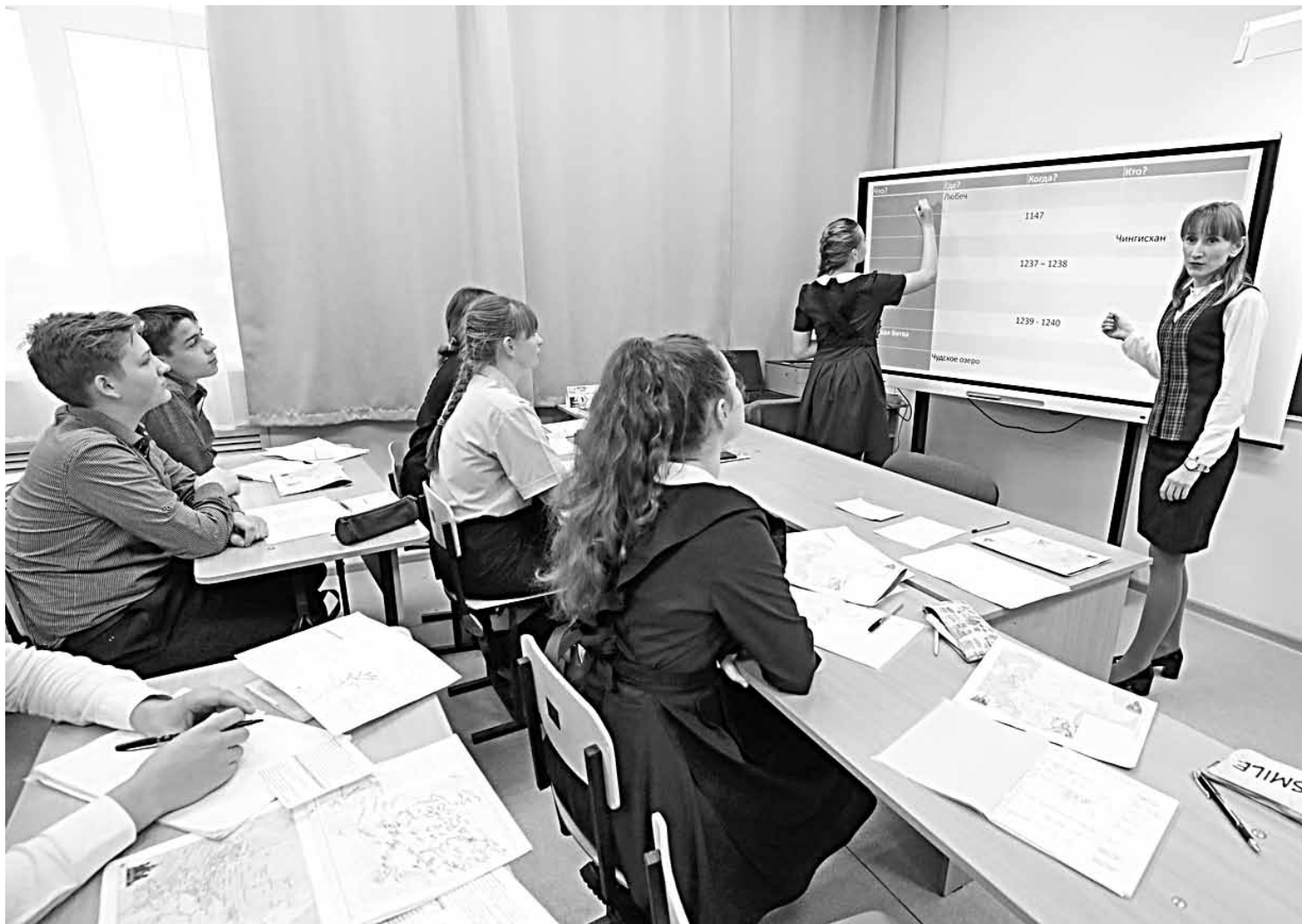
Несколько смарт-досок для школ района приобрели в рамках нацпроекта «Образование»

Почему только час? Потому что расписание очень насыщенное. И учебными делами детям нужно заниматься дозированно, иначе проку никакого не бу-