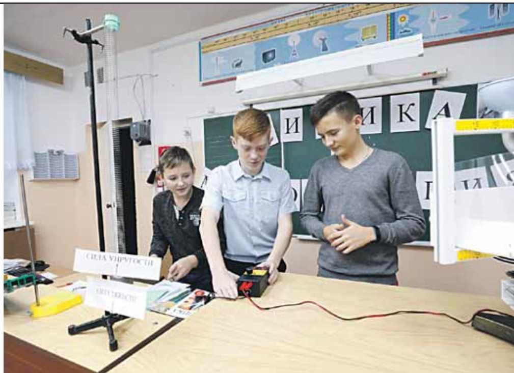
Занятия в кабинете физики. Школа № 1

А ещё школе повезло в том, что она построена единым комплексом с красноярским ФОКом. И школьники могут заниматься в его бассейнах, тренажёрных и спортивных залах. Мало того, по рекомендации врачей мальчишки и девчонки могут в ФОКе бесплатно пройти курс массажа!