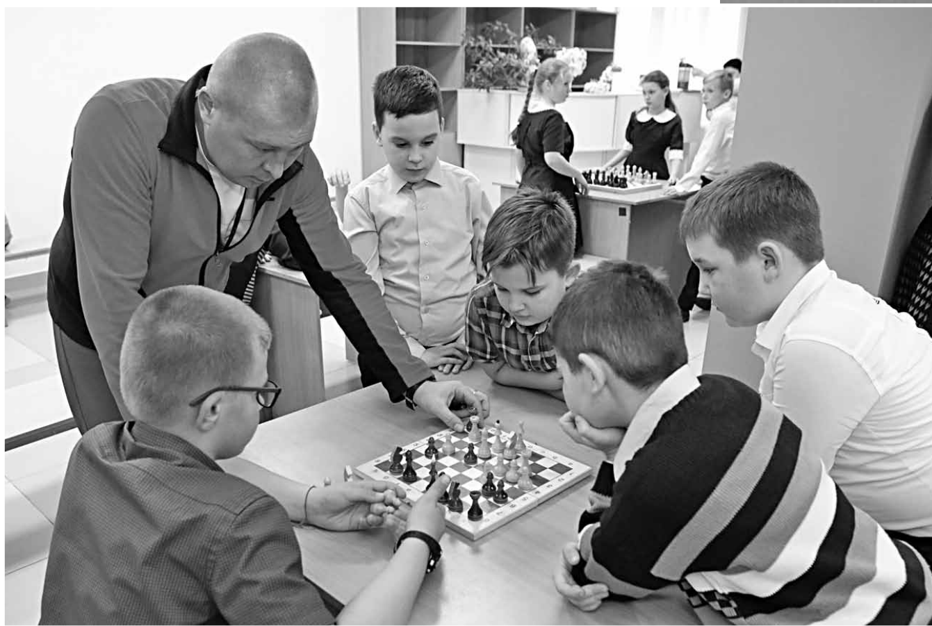
Шахматные перемены в Красноярской школе № 2