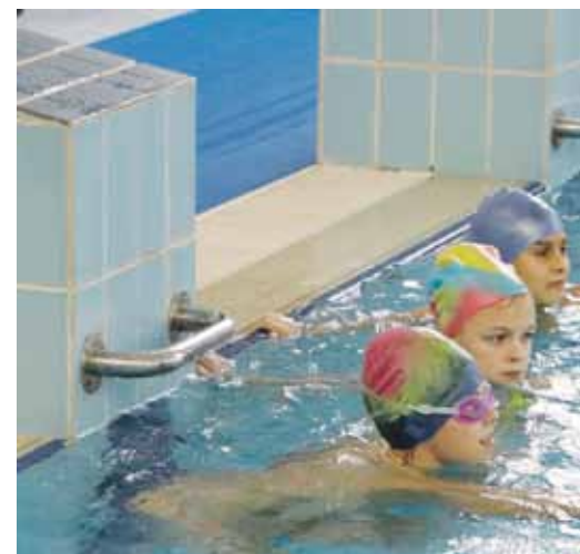
Ученики школы № 2 занимаются в бассейне ФОКа