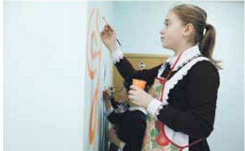
Ученики Степнянской школы сами разукрашивают стены