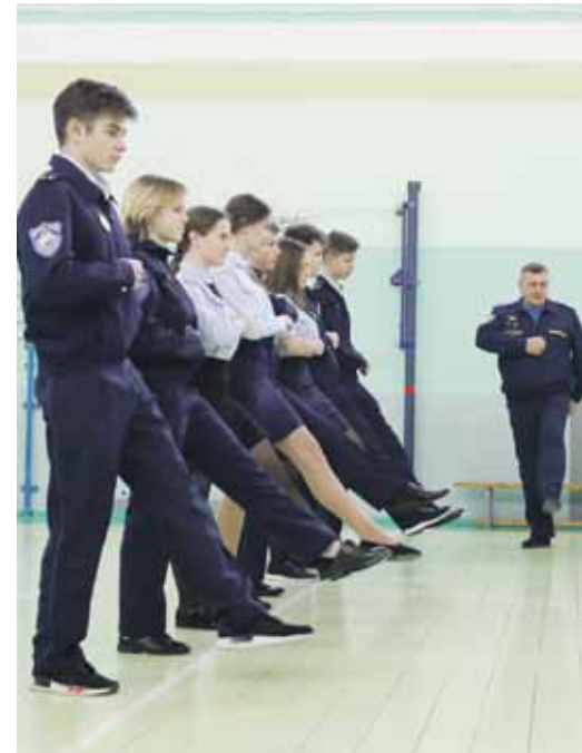
Строевая подготовка у кадетов в школе № 2