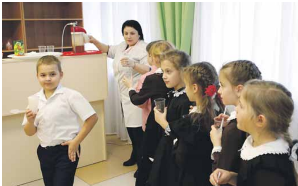
Каждый ученик школы № 2 за год проходит курс кислородных коктейлей

Школу села Степное часто называют многонациональной. Так сложилось, что в 90-е годы сюда переехали жить несколько десятков семей турок-месхетинцев. Люди здесь прижились, построили дома, родили детей, нашли работу... Но есть одно маленькое но: в большинстве семей до сих пор говорят на родном языке и в селе много детей, вынужденных знать два языка. Но в школе-то обучение ведётся на русском. И все экзамены нужно сдавать на русском языке.