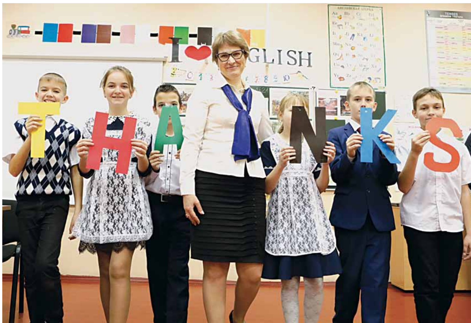
На дополнительных занятиях по английскому языку в Илёк-Пеньковской школе Краснояружского района

Школа полного дня — явление не новое для отечественной педагогической практики. Интерес к этой теме то утихает, то вновь возрастает. Новое осмысление она получила в связи с региональной стратегией «Доброжелательная школа», реализация которой рассчитана на 2019–2021 годы.